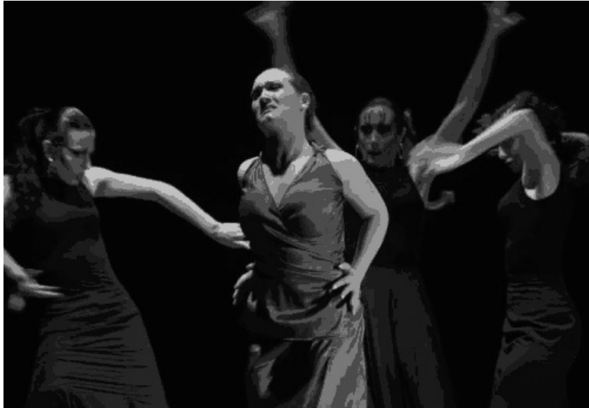
Yerma. Teatro Luna. Universidad de Sevilla

Equiparar los beneficios recibidos por los alumnos que asisten a dichas aulas de teatro al de otras actividades similares de extensión universitaria (créditos, becas, etc...)