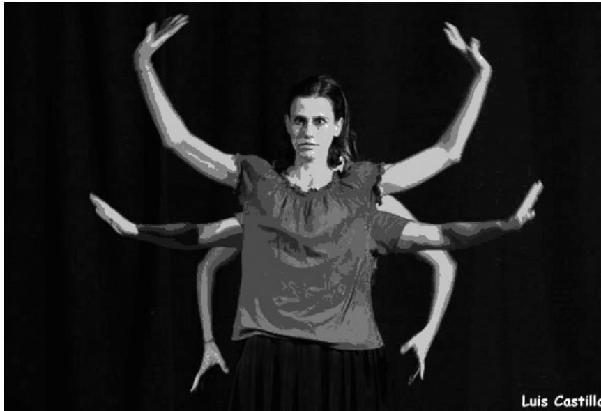
Las asesinas. Thetys Teatro. Universidad de Sevilla.

La pertenencia a Aulas o grupos de teatro universitario no es reconocida con créditos en ninguna de las demás universidades públicas andaluzas.