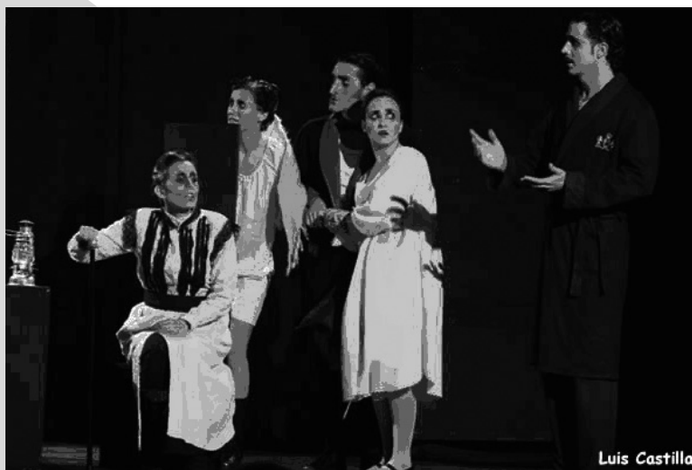
A buenas horas. Cuatro Gatos Teatro. Universidad de Sevilla.

Merece especial mención el caso de los grupos de teatro surgidos en la Universidad de Sevilla, donde algunos de los responsables de los grupos consultados afirman tener gran parte de la escenografía de sus montajes en sus propias casas, incluso en sus garajes.