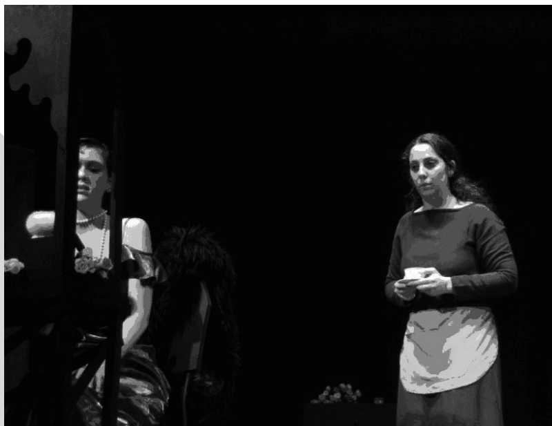
Las criadas. Aula de Teatro. Universidad de Almería.