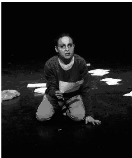
Café turco. Aula de Teatro. Universidad de Granada.

Esto incide de forma importante en la composición de las aulas de teatro. No es lo mismo tener que alquilar un autobús para un desplazamiento de un grupo de cuarenta personas que hacerlo de un grupo de ocho, donde incluso con un par de coches de alquiler se puede solucionar un viaje.