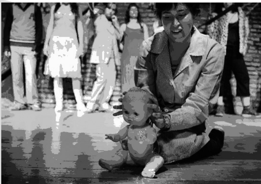
Ojos de lago. Producción propia del Servicio de Promoción Cultural de la Universidad de Sevilla

No hemos considerado ni trayectorias pasadas ni previsiones de futuro salvo cuando han sido estrictamente necesarias para entender una realidad actual. Este estudio refleja la actualidad del teatro universitario andaluz durante el curso académico 2005 / 2006.