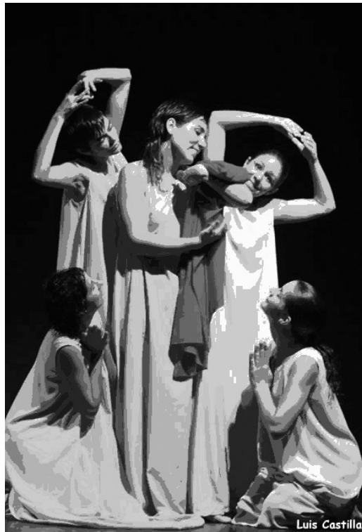
Soliloquios. La Escalera Teatro. Universidad Pablo de Olavide.

Al existir tantas realidades distintas en las universidades andaluzas (grupos independientes, talleres anuales, grupos concertados con asociaciones culturales, etc...) resulta muy difícil encontrar criterios comunes a la hora de designar una adecuada dotación económica que fomente la actividad teatral universitaria.