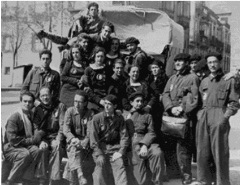
Teatro Universitario "La Barraca", Universidad de Granada. 1932

En los nuevos tiempos que viven las universidades públicas andaluzas, donde por fin se unifican criterios y estrategias de trabajo conjuntas en materia cultural, era necesario hacer un estudio diagnóstico de la situación que viven las Aulas de Teatro Universitarias, y definir cuáles son las debidas y siempre necesarias acciones de mejora.