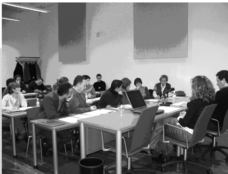
Vicerrectores y representantes de las Aulas de Teatro andaluzas durante la elaboración del Manifiesto.

En definitiva, se trata de devolver a las aulas de teatro el papel que históricamente han jugado en las universidades como vehículo de transmisión cultural y social. Tratarlas con el debido respeto.