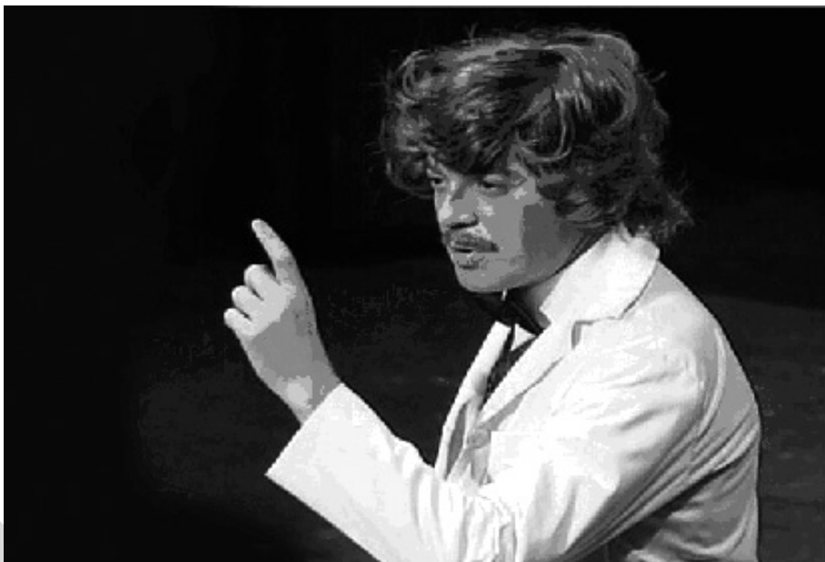
La Criatura. La Jaula Teatro. Universidad de Huelva

Las Universidades españolas disponen, en su mayoría, de formaciones teatrales que están deseando mostrar sus trabajos por otras ciudades.