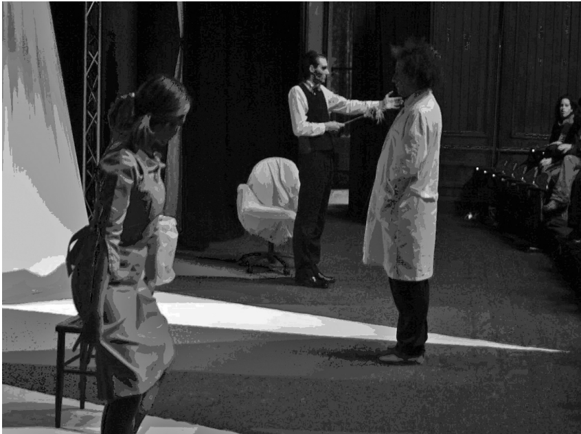
La lección. Aula de Teatro de la Universidad de Granada

Quizás, al no haber recibido una herencia teatral que mantener, enmendar, enderezar o corregir, han tenido la ventaja de proponer la actividad teatral partiendo de cero y con una visión ya experta de cómo funcionaba en otras universidades cercanas y más consolidadas.