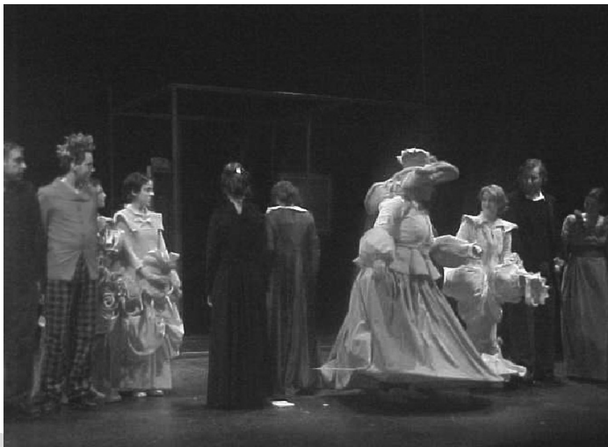
El lenguaje de las flores o Doña Rosita la soltera. In Vitro Teatro. Universidad de Jaén

El caso principal en Andalucía se da en la Universidad de Sevilla, (donde se contabilizan en activo alrededor de diez grupos distintos, pero no todos con espectáculos en cartel) aunque existen casos aislados en la Universidad de Córdoba 1 (dos grupos, uno en Filosofía y otro en Derecho), Cádiz (un grupo formado por alumnos de varias facultades) y Málaga (un grupo asociado pero que nace de una asociación cultural ajena a la Universidad de Málaga).