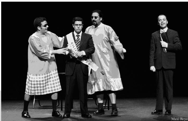
La Jaula Flying Circus. La Jaula Teatro. Universidad de Huelva

La actividad teatral universitaria, cuando está centralizada desde la propia Universidad, suele estar enmarcada en las competencias del Vicerrectorado de Extensión Universitaria (de Cultura en el caso de la Universidad de Málaga y de Promoción Universitaria en la de Córdoba), por lo que se considera una actividad más de las ofertadas al margen de la propiamente académica.