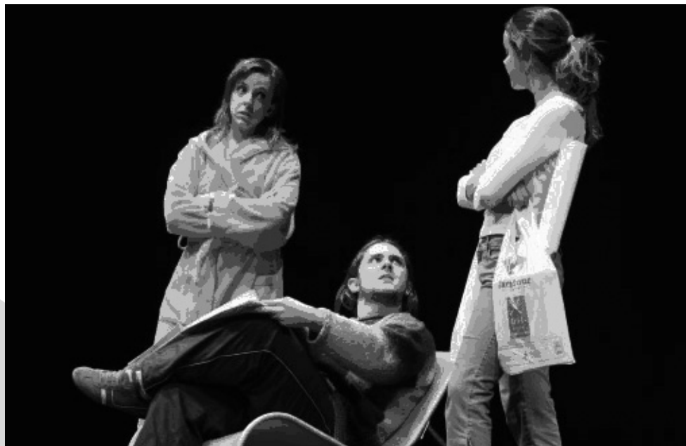
Pollos a mitad de precio. Troteatro. Universidad de Sevilla

De este modo, aunque los directores más previsores vayan preparando sus textos para el año siguiente con suficiente antelación, resulta a veces inútil puesto que no se sabe con certeza si al comienzo de curso van a ser muchos o pocos los alumnos participantes.