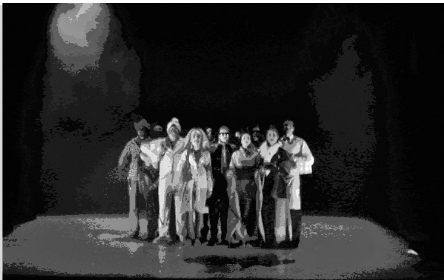
Están dormidos. Aula de Teatro. Universidad de Cádiz.

En el caso de la Universidad de Sevilla, donde no existe una labor de Aula de Teatro colectiva, sino que son los propios estudiantes los que se organizan en grupos de teatro, son las propias facultades las que proporcionan el espacio para ensayar, guardar los enseres y exhibir sus trabajos.