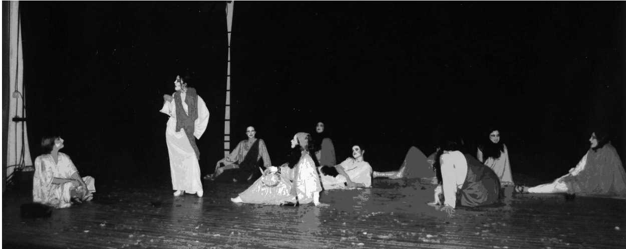
La Asamblea de las mujeres. Grupo Sémele. Universidad de Málaga.

Jaén, Almería y Pablo de Olavide. En la Universidad de Sevilla se contrata a un director para montar una producción propia de la Universidad una vez al año.