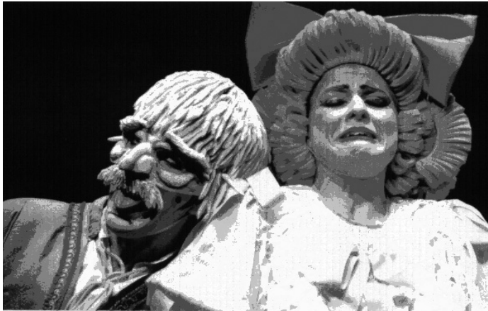
Los Títeres de la Cachiporra. Caramba Teatro. Universidad de Cádiz.

Considerar la actividad teatral como pieza clave de la formación en valores del estudiante y la comunidad universitaria, no relegándola al último lugar de las ofertadas por la universidad.