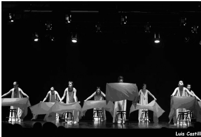
Soliloquios. La Escalera Teatro. Universidad Pablo de Olavide.

La actividad creadora de estos grupos y aulas de teatro genera una gran cantidad de material de trabajo que ha surgido del montaje de sucesivas obras de teatro durante los años. De este modo, vestuario, atrezzo, decorados, maquillaje, utilería, cartelería y material de iluminación, principalmente, se acumulan en espacios no aptos para su almacenaje.