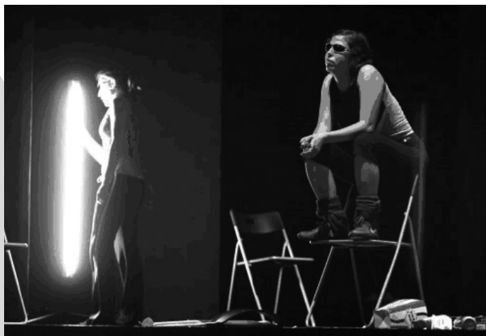
Reber. Tres Tristes Tigres. Universidad de Sevilla.

Conceder de forma permanente un espacio de trabajo para el Aula de Teatro, del mismo modo que se construyen salas para otras actividades (pabellones deportivos, laboratorios de foto-