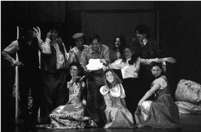
Abre el ojo. Aula de Teatro. Universidad de Almería

En el entorno universitario, entendemos por director a quien se encarga de formar a los alumnos interesados en el teatro que componen nuestras Aulas y grupos, pero también a quien se compromete a realizar prácticamente solo la producción de dichos espectáculos, diseña escenografías, vestuario, iluminación, ambientación musical, cartelería y material de promoción, etc... Asimismo es el encargado de acompañar a los grupos cuando salen de gira, siendo el máximo responsable de su correcto funcionamiento en todos los aspectos.